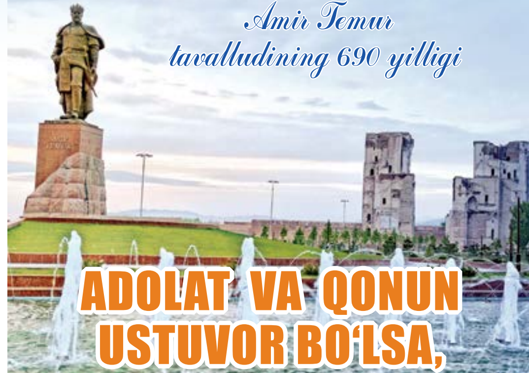
Amir Temur tavalludining 690 yilligi

Vazirlik tizimida va universitetlar huzurida tashkil etilayotgan yangi innovatsion korxonalar hamda ilmiy ekotizimlar amalda iqtidorli yoshlarning ko'nikmalarini real iqtisodiyotga tatbiq etishga xizmat qiladi. Mazkur yangicha ilmiy-amaliy platformalar orqali nafaqat muhandislar, balki jamiyathunos va tilshunos izlanuvchilarning ham o'z intellektual salohiyatini tijoriylashtirishi ko'zda tutilgan.