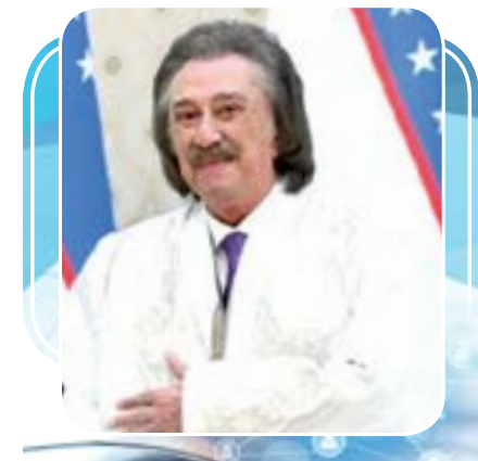
Farrux ZOKIROV, O'zbekiston xalq artisti, "Buyuk xizmatlari uchun" ordeni sohibi