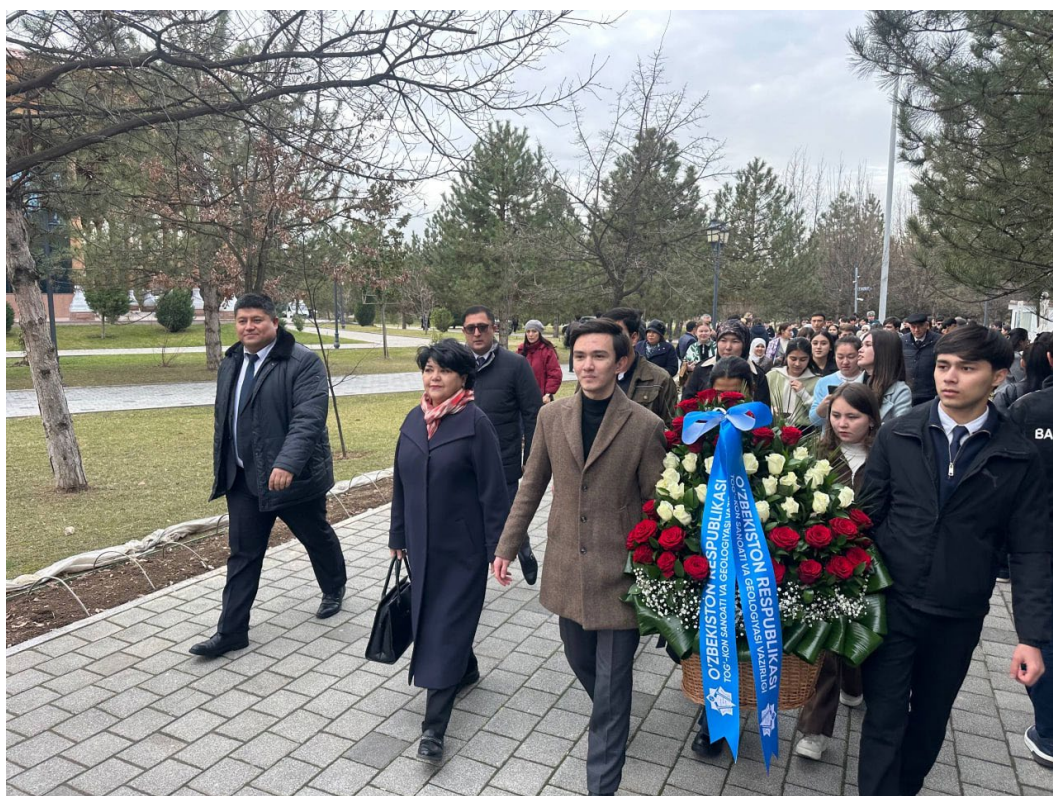
Mazkur tadbirda Tog‘-kon sanoati va geologiya vazirligi hamda Geologiya fanlari universiteti mutasaddilari va talabalari faol ishtirok etdilar