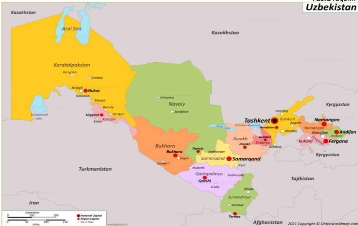
1-rasm: Loyiha hududi