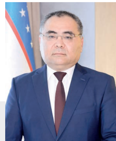
Иброҳим АБДУРАҲМОҲОВ, Ўзбекистон Республикаси Қишлоқ хўжалиги вазири.

Дарҳақиқат, қишлоқ хўжалиги республикамиз иқтисодиёти тармоқлари орасида салмоқли ўринни эгаллайди. Давлат раҳбари томонидан ҳар бир гектар ердан олинadиган даромадни устун даражада ошириш, илм-фан ютуқларини, инновацияларни ишлаб чиқаришга самарали жорий қилиш, ички бозорни арзон ва сифатли озиқ-овқат ва ноозиқ-овқат маҳсулотлари билан тўлиқ таъминлаш, шу билан бирга соҳанинг экспорт имкониятларини ошириш ана шу раҳбар ходимларнинг ҳалол