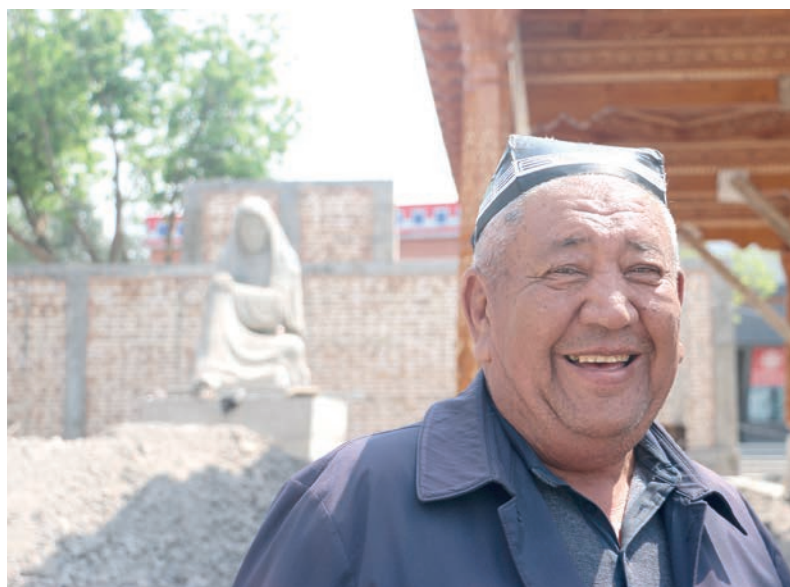
Суратда: Ўзбекистон халқ устаси, Муҳаммадали Юнусов иш жараёнида.

Бекобод тумани Зафар шаҳарчасида янги хотира майдони, тарих музейи, замонавий объектлар қурилиши авж олинди. Бундай файзли маскан барпо этишга тажрибали хунармандларнинг жалб қилинганлиги қувончлидир. Гап шундаки, водийлик Ўзбекистон халқ устаси, “Эл юрт хурмати” ордени соҳиби Муҳаммадали Юнусов бошчилигидаги маҳоратли усталарнинг яратувчанлик меҳнатини кўриб дилингиз яйрайди. – Бундай миллий руҳдаги нақш устунли айвонларни Имом ал Бухорий, Ат-Термизий, Ҳазрати Имом мажмуазийратгоҳларида барпо этганмиз, – дейди юртимизнинг машҳур ёғоч ўймақори, халқ устаси Муҳаммадали Юнусов. – Зеро, янги қурилаётган истиқболли манзиллар бетақдор миллий ўзлигимиз тимсолидир.